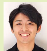
4年 部當 佳彦

大手企業は説明会開催地を福岡までしか設けないことが多いので、これだけ多種多様な企業のお話を熊大で聞くことが出来る機会ははとてありがたかったです！気軽に参加出来たため、就活の幅が広がりました！